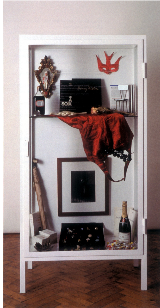
„Die Geburtstagszeremonie“, 1993