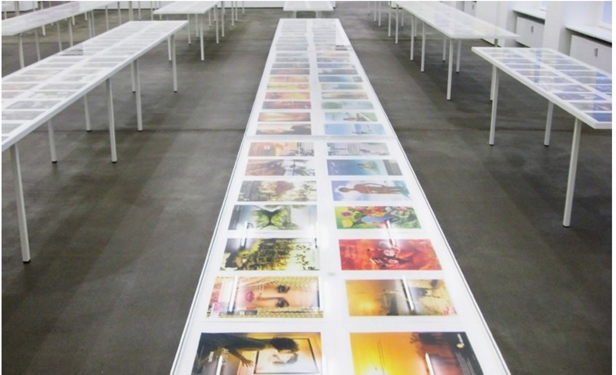
Fischli und Weiss „Sonne Mond und Sterne“, 2008