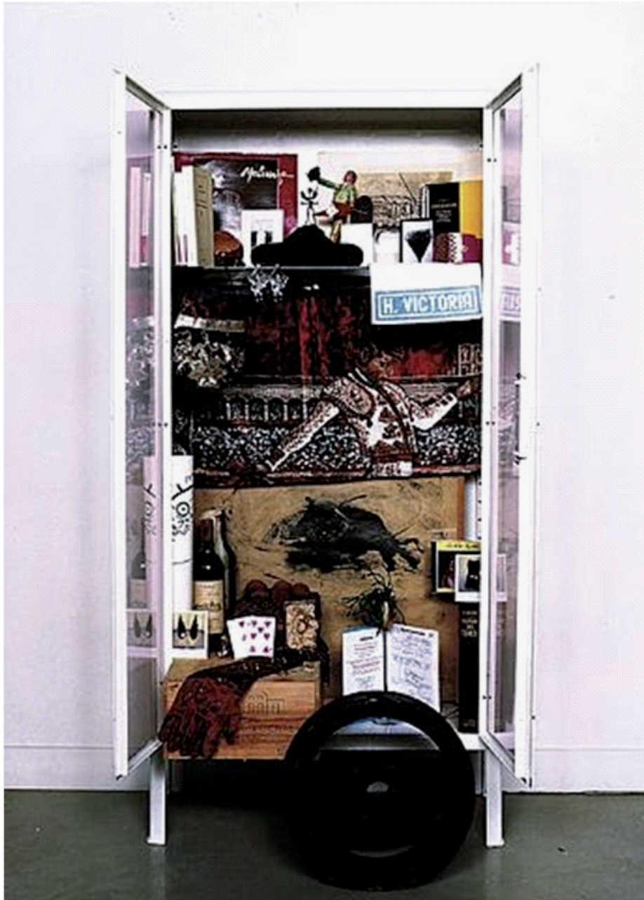
Sophie Calle „The Birthday Ceremony“, 1990“